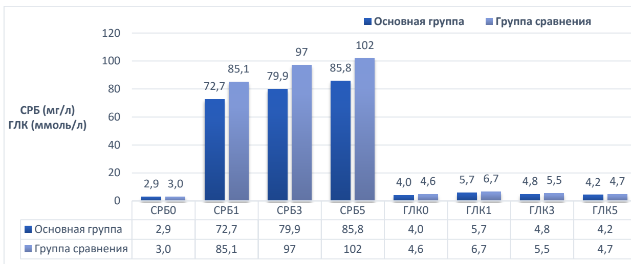
Рисунок 5 – Показатели степени выраженности хирургического стресс-ответа

Для оценки степени выраженности стресс – ответа на хирургическое вмешательство в исследовании использовали показатели СРБ (мг/л) и гликемии (ммоль/л). Средний уровень гипергликемии после реконструктивного вмешательства в группах сравнения был одинаковым, но стоит отметить, что стрессовая гипергликемия была зафиксирована у 9 (40,9%) пациентов в группе сравнения, вместе с тем в основной группе лишь у 2 (4,6%) пациентов ( p < 0,001 ).