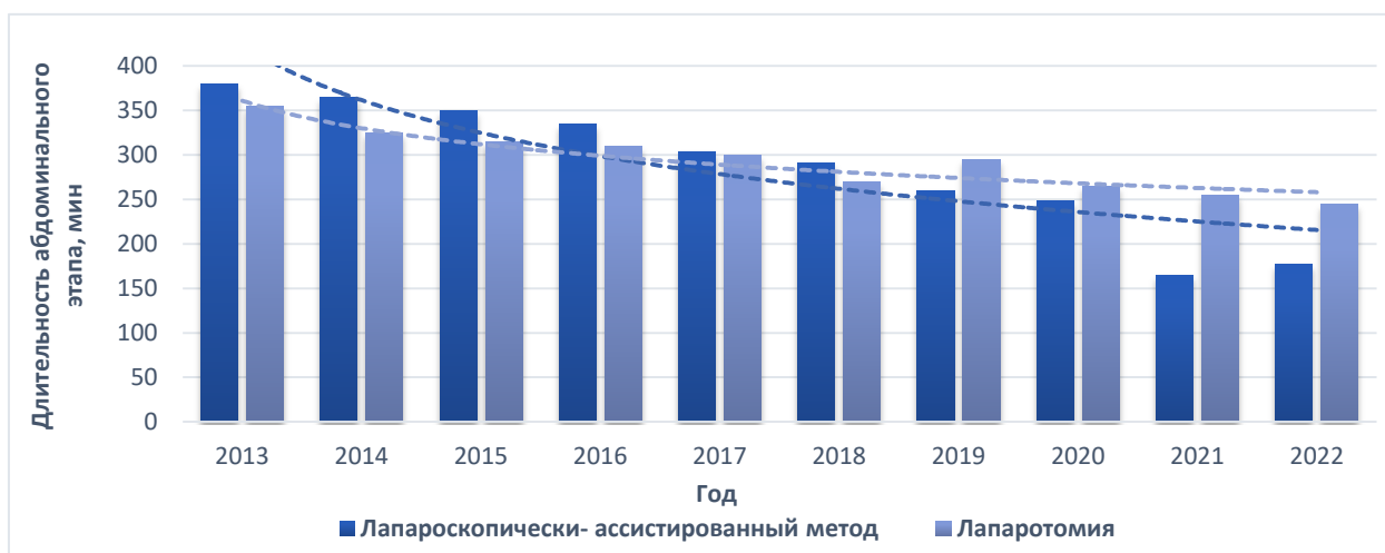
Рисунок 4 – Динамика продолжительности выполнения абдоминального этапа

С 2018 года в отделении торако-абдоминальной хирургии и онкологии, для сокращения продолжительности операции, реконструктивный этап выполняют две бригады хирургов, одна из которых проводит мобилизацию желудка, а вторая параллельно осуществляет доступ на шее, выделение шейного отдела пищевода и его пересечение. Как следствие, средняя продолжительность операции до 2018 года, когда операция полностью выполнялась одной бригадой хирургов, составила 415,8 \pm 59,6 мин, а после 2018 года – 368,7 \pm 93,7 мин ( p=0,019 ). Средняя продолжительность абдоминального этапа операции после 2018 года – 244,9 \pm 77,8 мин, что достоверно меньше, чем до 2018 года, p = 0,003 ( 301,8 \pm 60,9 мин).