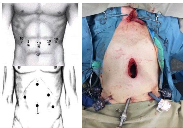
Рисунок 3 – Варианты расположения троакаров и минилапаротомии при лапароскопически-ассистированном абдоминальном этапе

Целью абдоминального этапа является мобилизация абдоминального отдела пищевода и желудка по большой и малой кривизнам с переходом к реконструктивной фазе операции. При стандартно выведенной гастростоме (по передней стенке желудка ближе к малой кривизне) и при отсутствии очевидного повреждения перигастральной сосудистой дуги реконструктивный этап начинали лапароскопически, стому предварительно ушивали непрерывным «временным» швом и погружали в брюшную полость. При применении лапароскопически-ассистированной методики это осуществляется с помощью ультразвукового диссектора с сохранением перигастральной сосудистой дуги по большой кривизне на питающей правой желудочно-сальниковой и, в ряде случаев, правой желудочной артериях (Рисунок 3). Затем в мезогастрии по средней линии выполняется минилапаротомия (3-5 см) через которую извлекается комплекс пищевод-желудок.